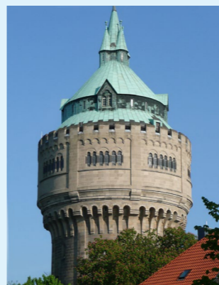
Wasserturm „Auf der Geist“

1973 Inbetriebnahme • Maximale Aufbereitungskapazität: 1.200 m 3 Grundwasser pro Stunde • Speichervolumen: 8.000 m 3 • Maximale Einspeisemenge in das Netz: etwa 1.100 m 3 Trinkwasser pro Stunde