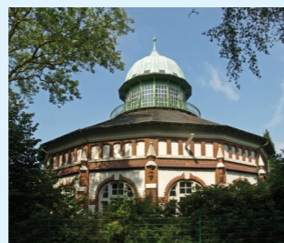
Wasserwerk Hohe Ward

1888 Inbetriebnahme • Maximale Aufbereitungskapazität: 1.000 m 3 Grundwasser pro Stunde • Speichervolumen: 12.000 m 3 • Maximale Einspeisemenge in das Netz: 1.600 m 3 Trinkwasser pro Stunde