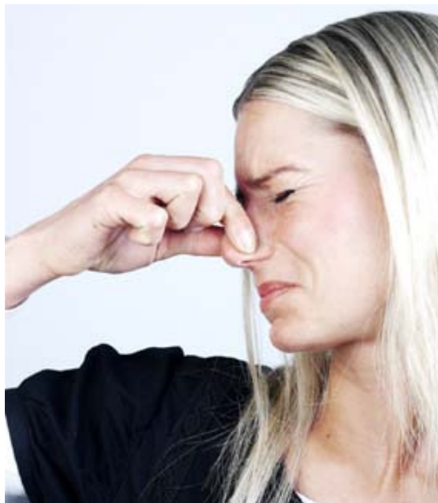
Das Erdgas der Stadtwerke Münster wird ab der nächsten Woche wieder nach faulen Eiern riechen.

Das Team der Entsstörungsstelle wird erfreulicherweise im Schnitt nur 120 mal im Jahr gerufen, und das bei mehr als 30.000 Hausanschlüssen in Münster. Vor Ort sind es dann äußerst selten ernsthafte Probleme, so dass nur in wenigen Fällen wirklich eine Störung